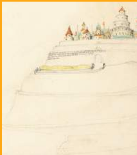
Stanburg o Steinborg, [1944] Carboncillo y lápices de colores, 24,1 x 18,4 cm.

Bodleian Library, MS. Tolkien Drawings 90, fol. 18.